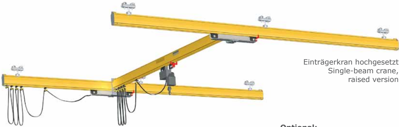
Einträgerkran hochgesetzt Single-beam crane, raised version

Single and double-beam cranes can be mounted on the ceiling or the floor with a free-standing support frame. Single and double-beam cranes are also available as raised cranes for use in lower rooms, where standard constructions would not be able to achieve sufficient lifting distances.