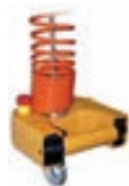
Manipuliergriff - Komfortable Einhandbedienung