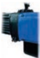
Schutzart IP 65