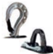
Ösen- oder Hakenaufhängung nach Wunsch